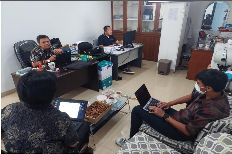
Gambar 2. Tahapan Penyajian Materi dan Diskusi

Narasumber menjelaskan tatacara penggunaan aplikasi kepada pengguna mulai dari proses input sales order , purchase order , delivery order hingga invoice serta memberikan penjelasan untuk proses input data master serta proses aplikasi yang harus dilakukan oleh pengguna.