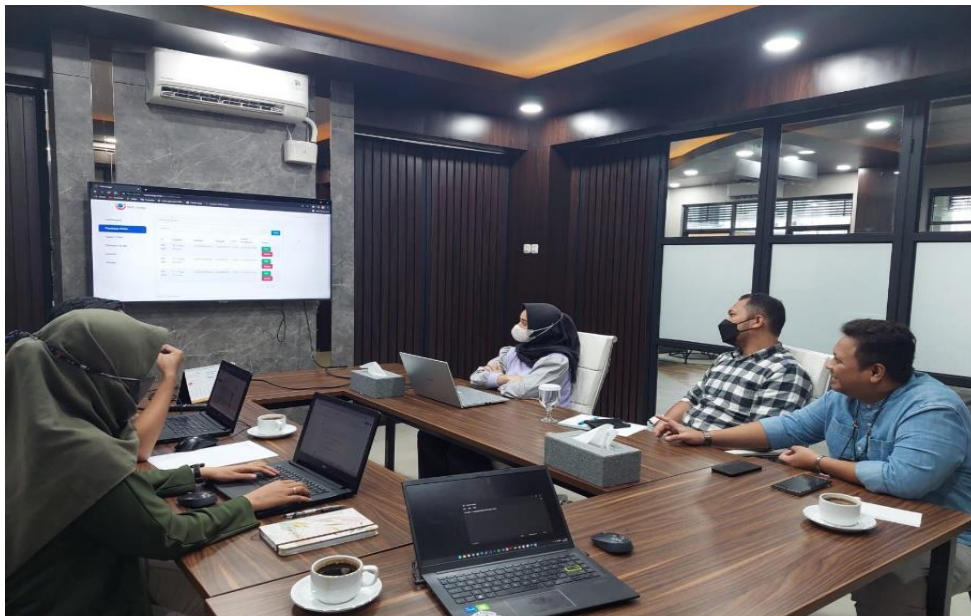
Gambar 3. Tahapan Demontrasi dan Latihan

Narasumber menjelaskan tatacara penggunaan aplikasi kepada pengguna mulai dari proses input sales order , purchase order , delivery order hingga invoice serta memberikan penjelasan untuk proses input data master serta proses aplikasi yang harus dilakukan oleh pengguna.